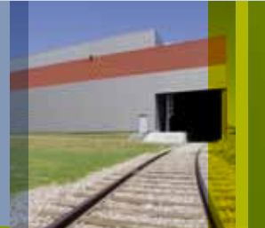
STOCKESPACE Le Havre